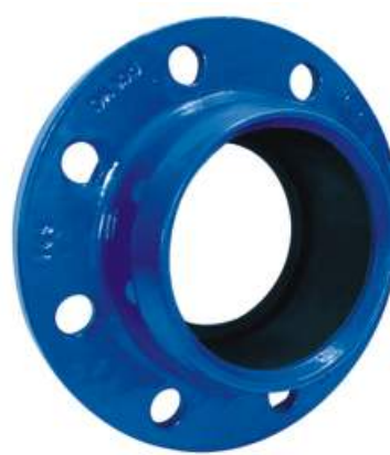
FACILE PVC (без кольца)