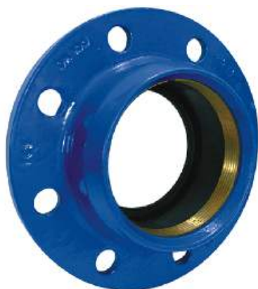
FACILE R (с кольцом)